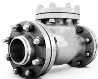
ЗАТВОРЫ (КЛАПАНЫ) ОБРАТНЫЕ ПОВОРОТНЫЕ СТАЛЬНЫЕ