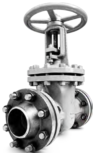
ЗАДВИЖКИ СТАЛЬНЫЕ КЛИНОВЫЕ ЛИТЫЕ С ВЫДВИЖНЫМ И НЕВЫДВИЖНЫМ ШПИДЕЛЕМ