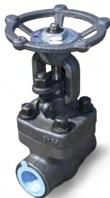
ЗАДВИЖКИ КОВАНЫЕ СТАЛЬНЫЕ (ЗКС)