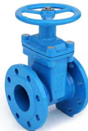
ЗАДВИЖКИ ЧУГУННЫЕ С ОБРЕЗИНЕННЫМ КЛИНОМ