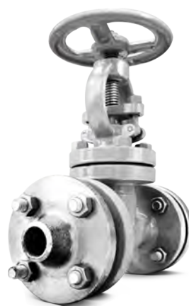
КЛАПАНЫ ЗАПОРНЫЕ СТАЛЬНЫЕ